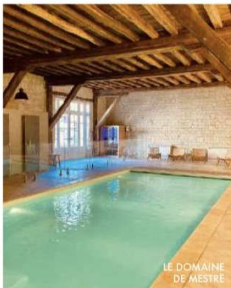
LE DOMAINE DE MESTRÉ