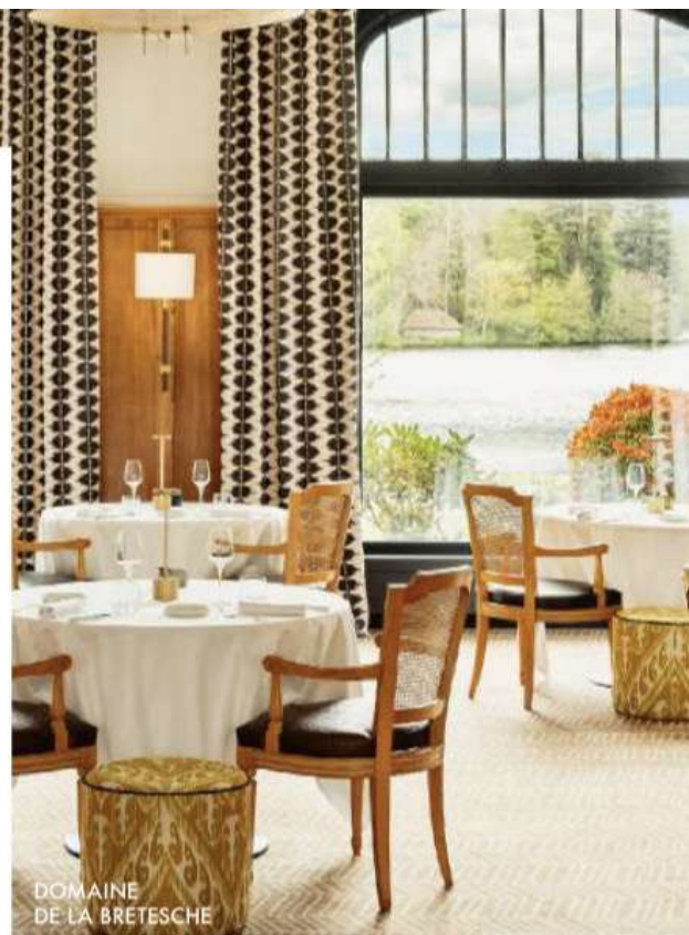
DOMAINE DE LA BRETESCHE

La Bretesche, Missillac (44). Tél. : 02 51 76 86 96. bretesche.com