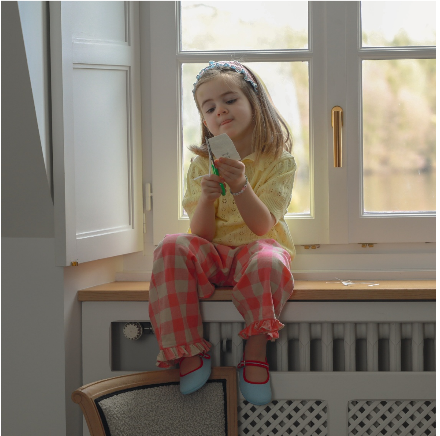
Toscane porte un polo et un pantalon Bebe Organic . Ballerines Hermosilla . Dans les cheveux, serre-tête Gingersnaps .