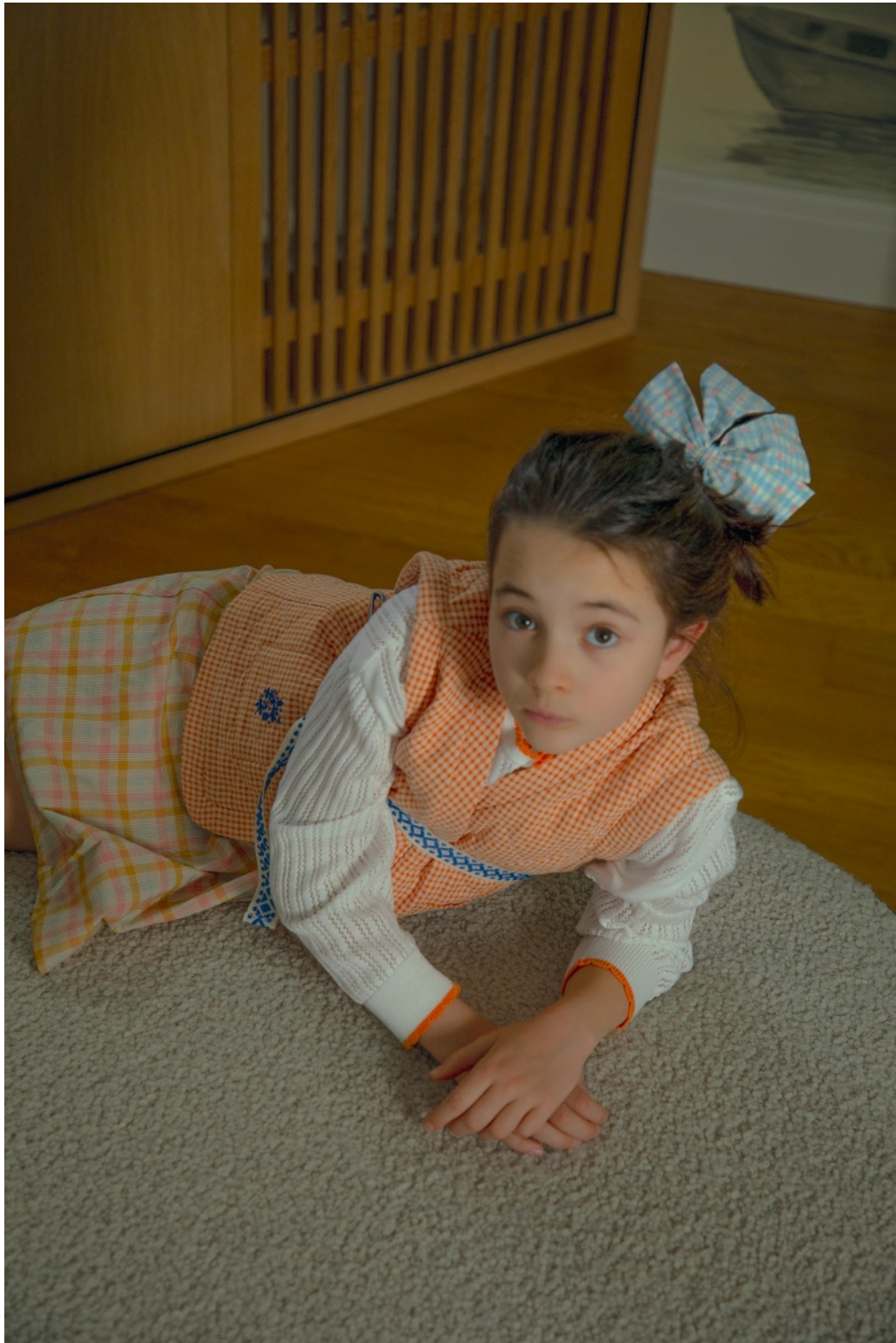
Louise porte une veste sans manches The Little Poets sur un cardigan The Sunday Collective et une robe Bebe Organic . Dans les cheveux, barrette Bebe Organic .