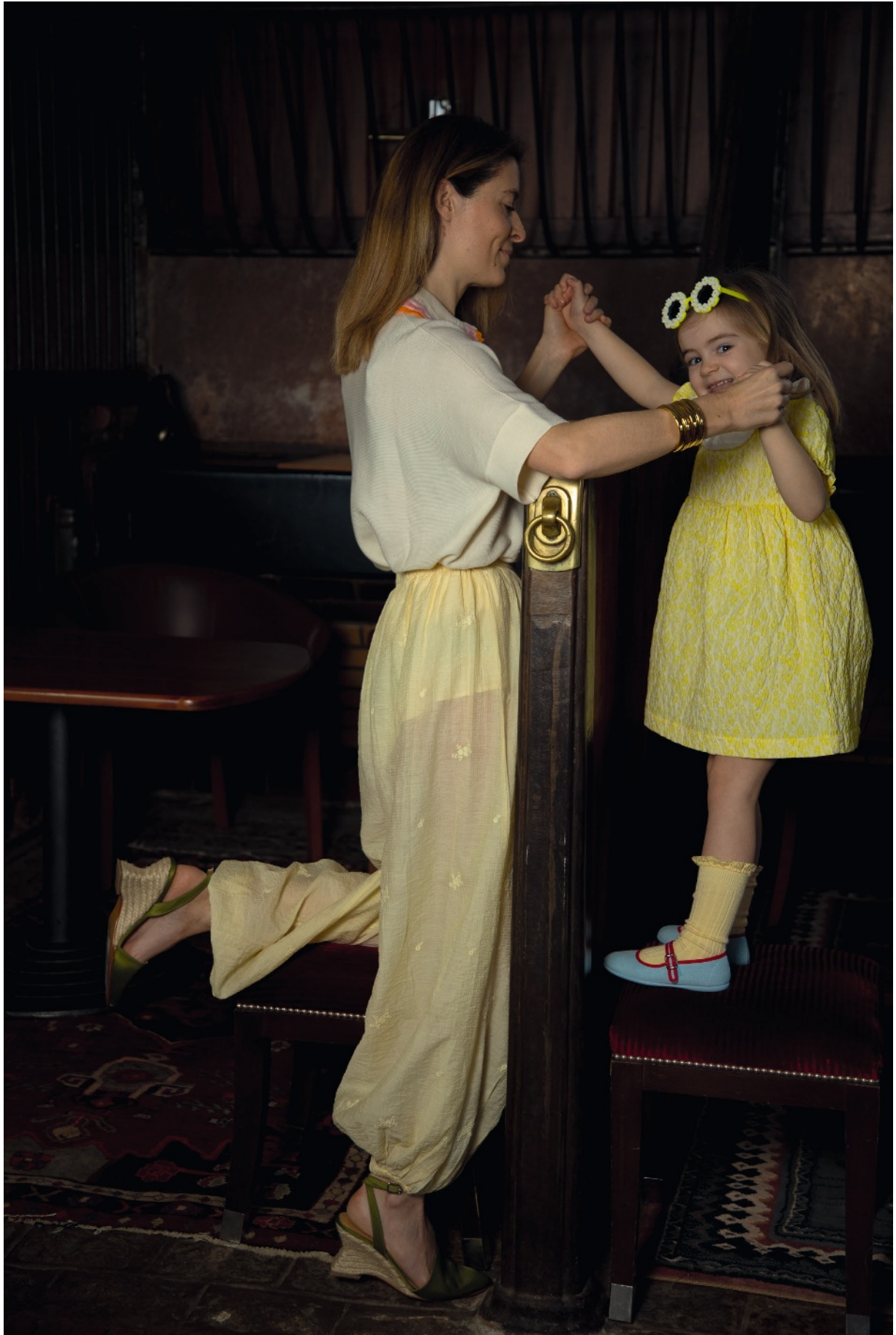
Hélène porte un polo Molli sur un pantalon Bérénice . Chaussures Castañer . Manchette Agatha . Toscane porte une robe C'era una Volta , des chaussettes Collégien et des ballerines Hermosilla . Dans les cheveux, lunettes Billieblush .